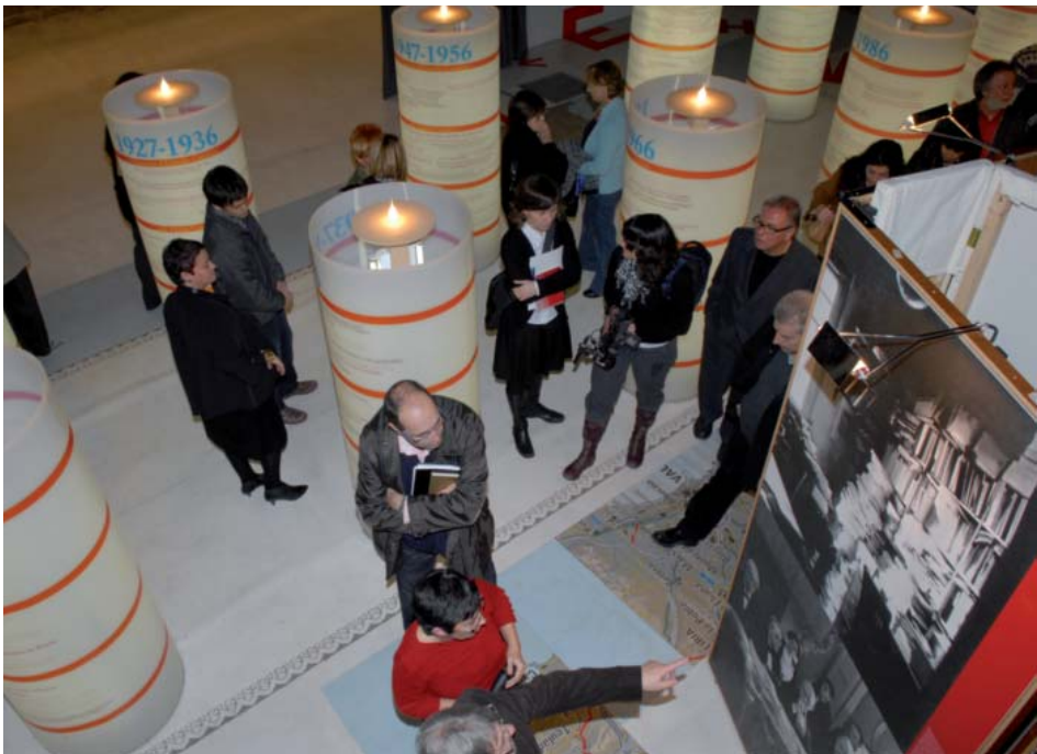
Badalona, Espai Betúlia, 18 de desembre de 2008.