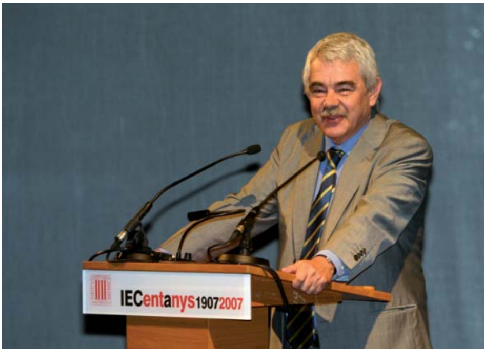
El president de la Generalitat fent el seu parlament.