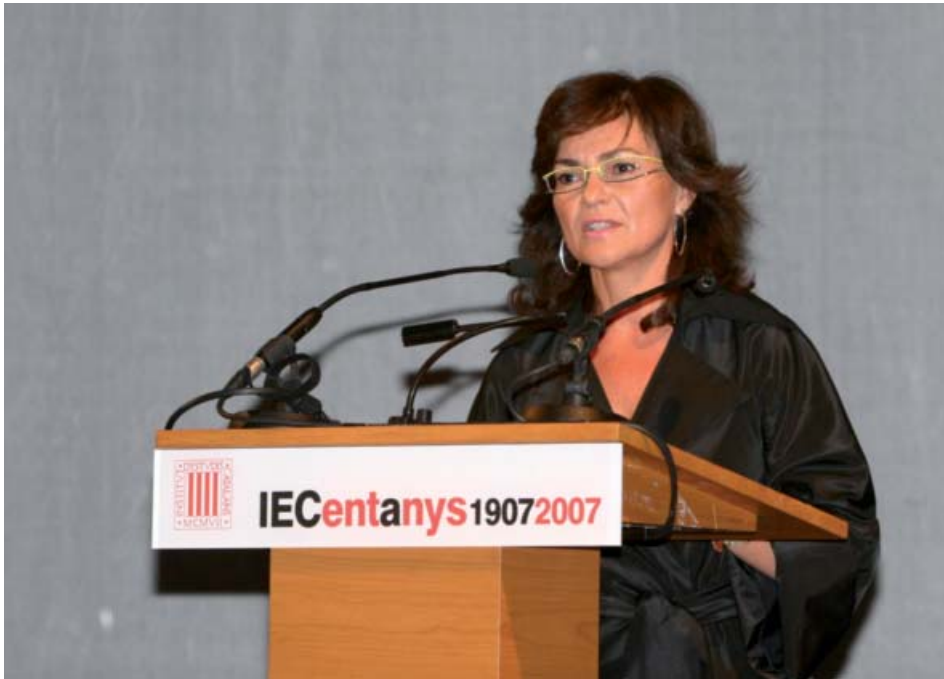
La ministra de Cultura dirigint-se a l'auditori.