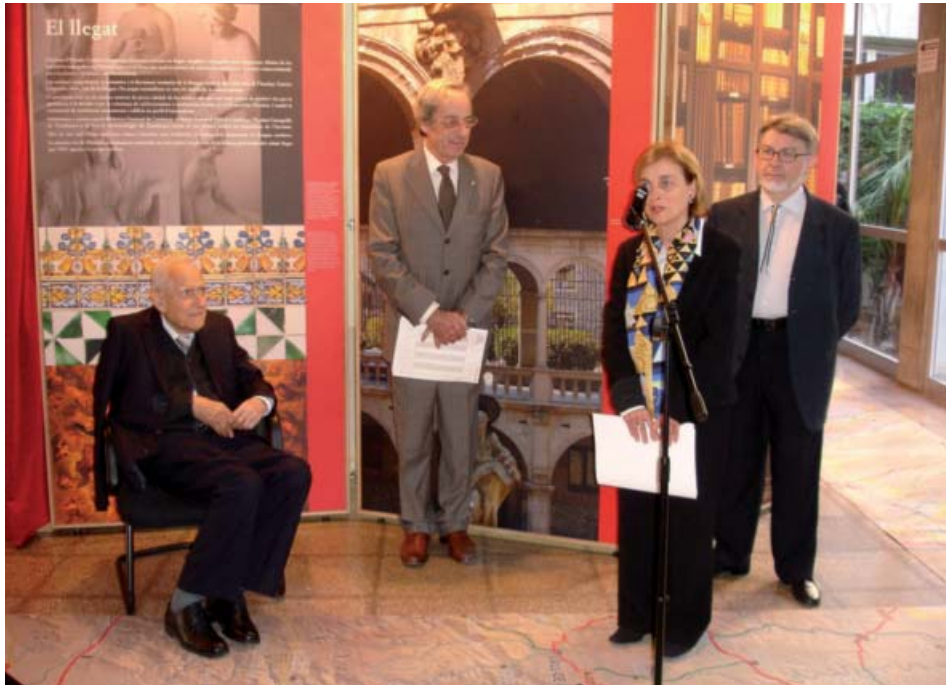
Palma, edifici Ramon Llull de la Universitat de les Illes Balears, 8 de novembre de 2007.