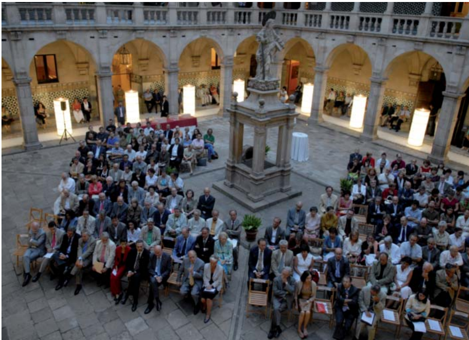
Barcelona, seu de l'IEC de la Casa de Convalescència, 12 de setembre de 2007.