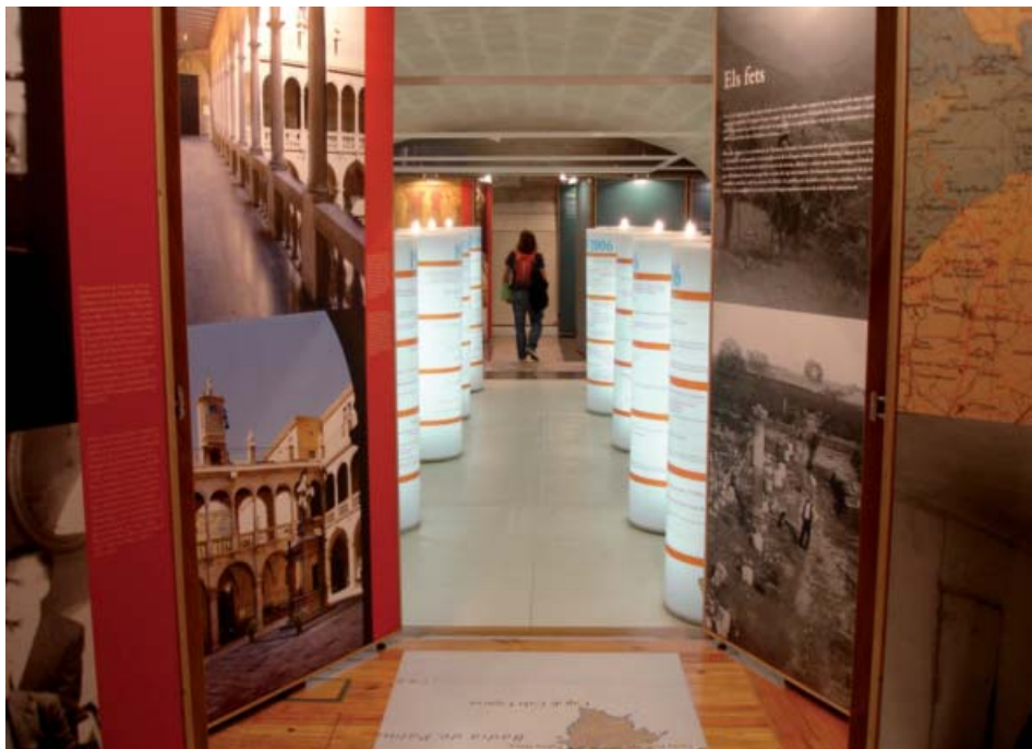
Maó, Institut Menorquí d'Estudis, desembre de 2007.