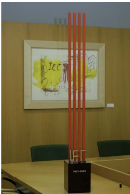
Escultura commemorativa del Centenari, obra d'Andreu Alfaro.