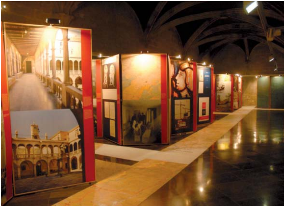
Lleida, Institut d'Estudis Ilerdencs, antic Hospital de Santa Maria, juliol de 2008.