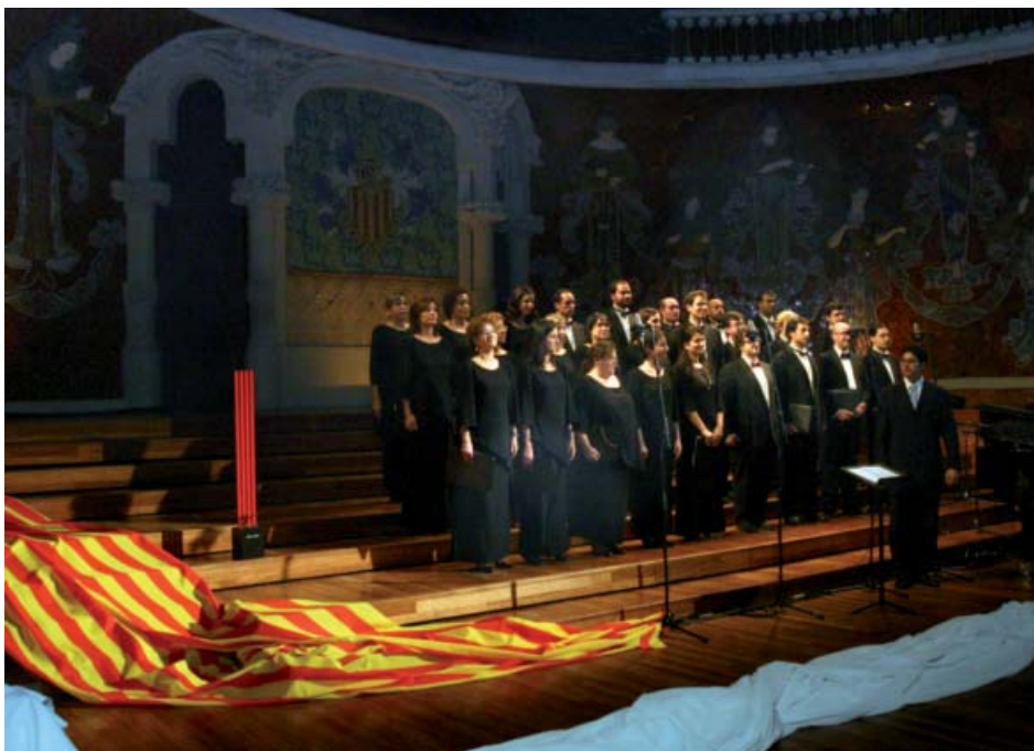
Escenari del Palau amb el cor al costat de l'escultura commemorativa del centenari, obra d'Andreu Alfaro.