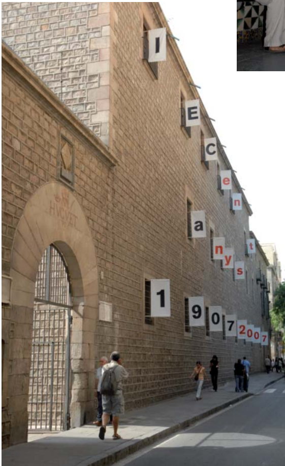
Façana de l'IEC durant l'exposició.