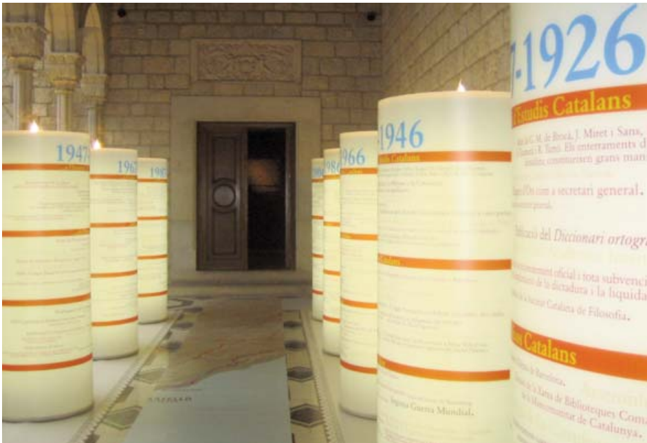
Girona, Centre Cultural de Caixa Girona Fontana d'Or, 13 d'abril de 2007.