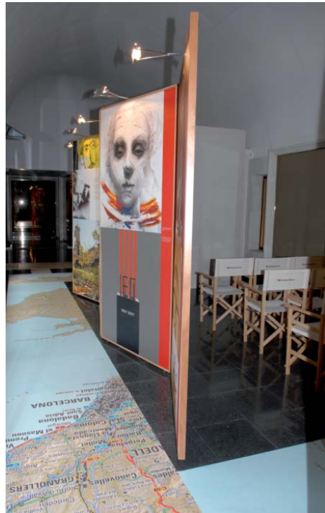
Andorra, Claustre dels Miralls del santuari de Meritxell, 7 de juny de 2007.