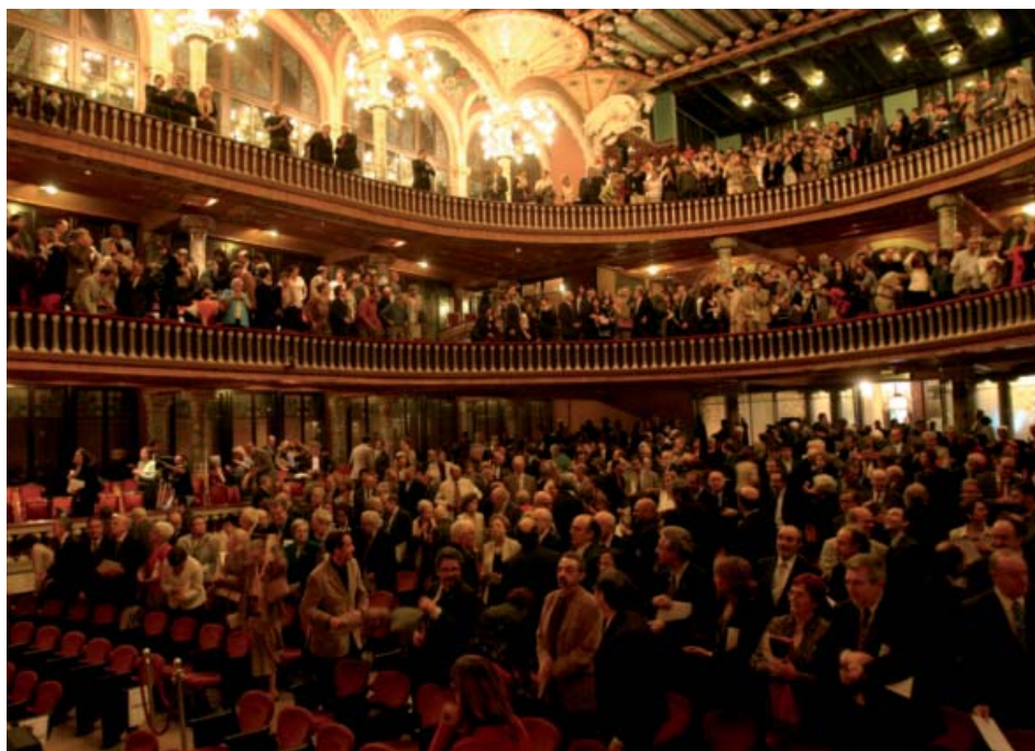
Aspecte general del públic assistent a l'acte d'inauguració.