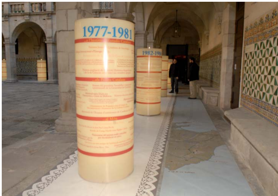
Diversos aspectes de l'exposició de Barcelona, seu de l'IEC de la Casa de Convalescència, desembre de 2007.