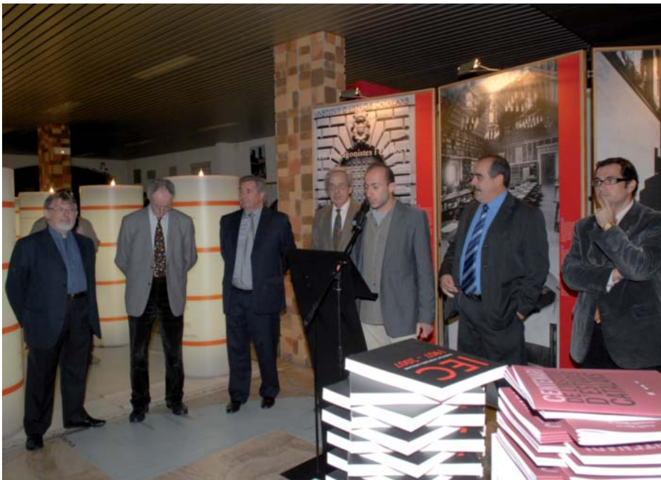
Ajuntament d'Elna, 12 de novembre de 2008.